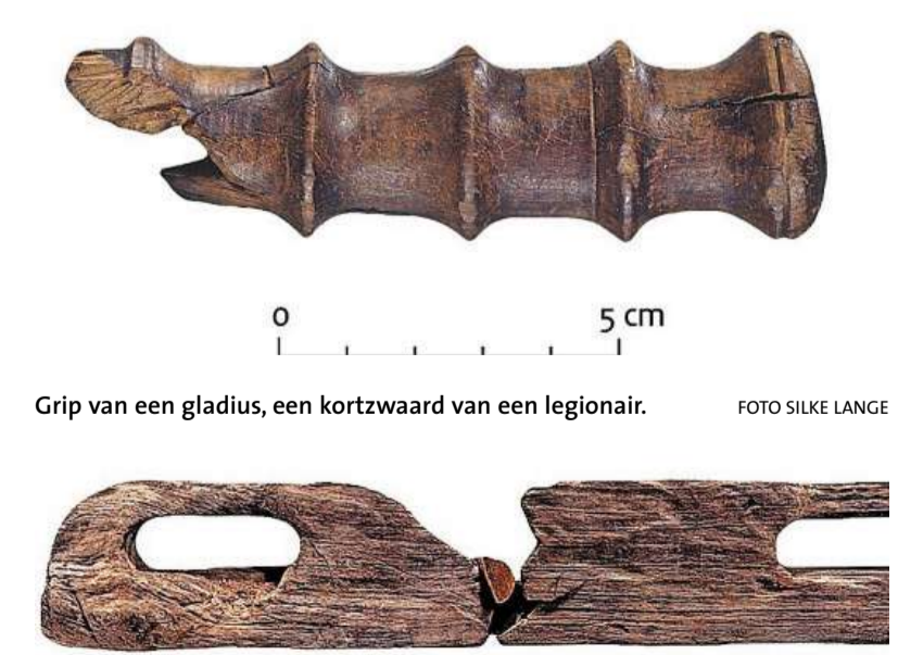
Grip van een gladius, een kortzwaard van een legionair.