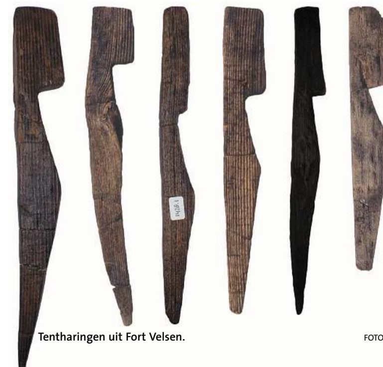
Tentharingen uit Fort Velsen.