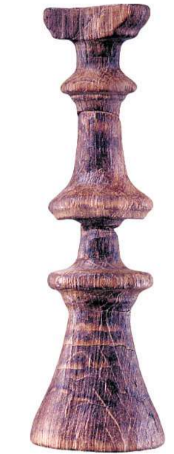
Gedraaide beddenpot.

„We mogen onszelf rijk rekenen dat we hier zoveel hout hebben gevonden