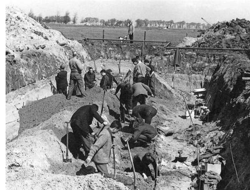
Opgravingen bij Fort Velsen I.

En, pragmatisch: het museum wil snel aan de slag met de ingekerfde teksten in de talrijke schrijflankjes. De Romeinen krasten met een stift in was, maar drukten soms zo diep dat de tekens doordrukten in het hout. „We hebben nooit de moeite genomen om die teksten te vertalen. Daar hebben we nu speciaal een groot apparaat voor gekocht.”