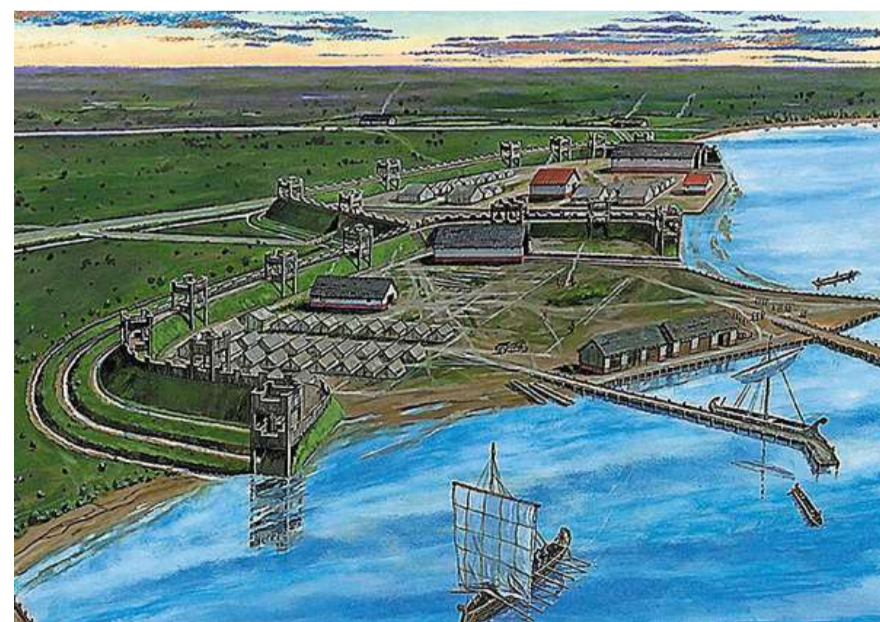
Impressie van hoe Fort Velsen eruit gezien moet hebben.